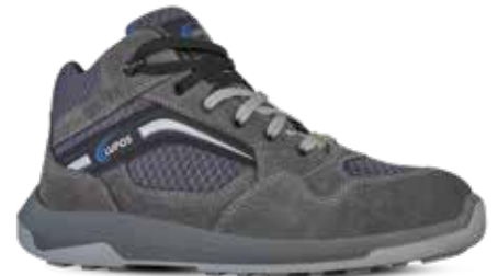
CIRCUIT S1P ESD