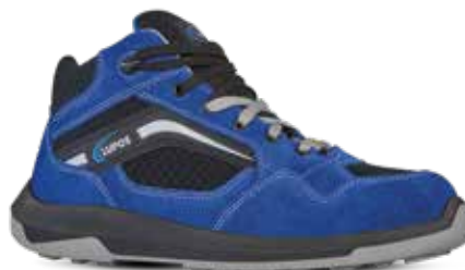
EPIC S1P ESD