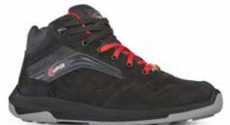
TRIDE S3 ESD