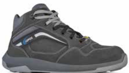
TYPE S3 ESD