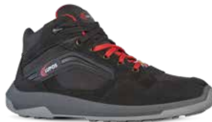
PRINT S3 ESD