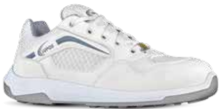
CLIP S1P ESD