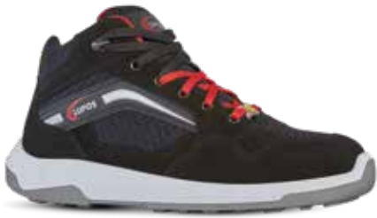
SYNC S1P ESD