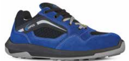
PACE S1P ESD