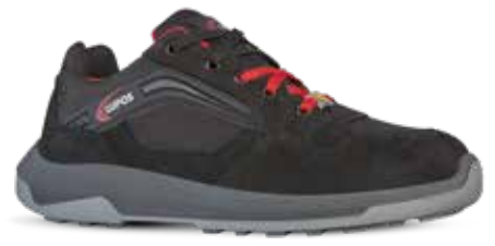
WALK S3 ESD