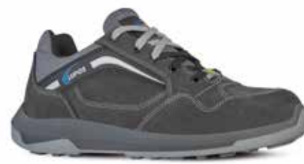
CLYDE S3 ESD