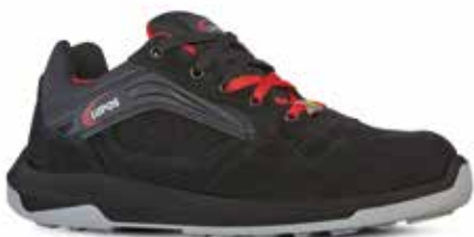
LOCK S3 ESD