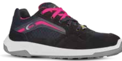
GLORY S1P ESD