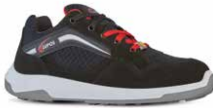
LITE S1P ESD