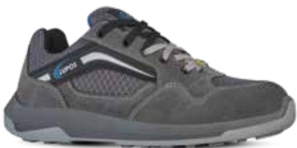
REAGO S1P ESD